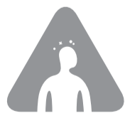
Δείκτες ανθρώπινης δυσφορίας