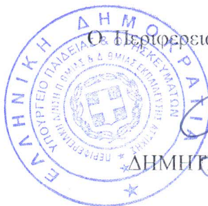
ΜΑΥΡΟΕΙΔΗΣ ΝΙΚΟΛΑΟΣ ΦΥΣΙΚΟΣ Ρ/Η